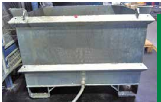
4 AUFFANGCONTAINER MIT DOPPELWANDIGEM BODEN, SPÄNESIEB UND ABLASSVORRICHTUNG FÜR EMULSIONEN

Für das Auffangen der Späne am Ort der Entstehung können beispielsweise Kippbehälter zum Einsatz kommen, die in jeder Größe erhältlich und mit einem Ablaufhahn oder einer Schlauchverbindung zur Rückführung von Emulsionen oder Schneidölen ausgestattet sind, siehe Bild 1 - 4. Es ist verstärkt auf die Dichtigkeit der Container zu achten. Die Doppelwandigkeit des Behälterbodens kann hier unterstützend wirken.